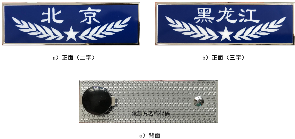
图 1 胸徽样式结构